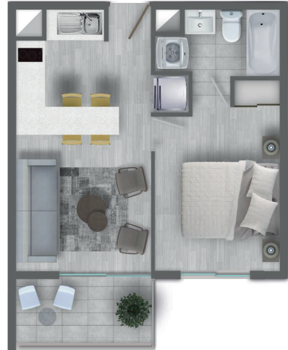
DEPARTAMENTO TIPO A | 1 DORM - 1 BAÑO

Sup. Útil: 32,07 mt 2 Sup. Terraza: 6,21 mt 2 Sup. Total: 38,28 mt 2