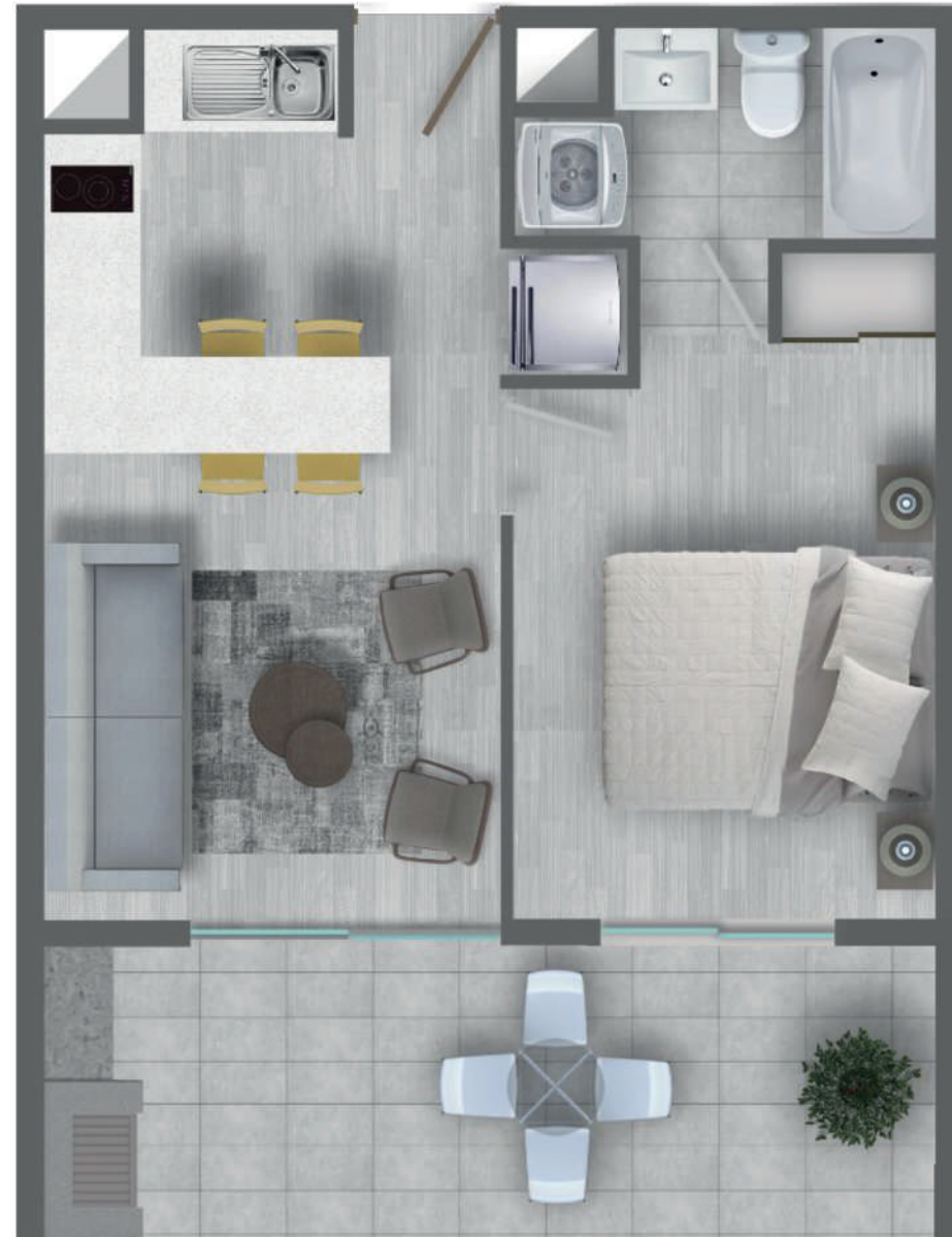
DEPARTAMENTO TIPO A (P1) | 1 DORM - 1 BAÑO

Sup. Útil: 32,07 mt 2 Sup. Terraza: 14,00 mt 2 Sup. Total: 46,07 mt 2